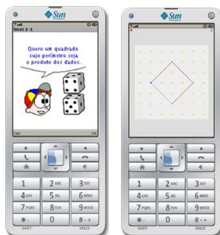
Figura 2: Jogo GeoplanoMob em execução.

O GeoplanoMob foi concebido para aparelhos celulares para permitir ao usuário atividades rápidas e com mobilidade, em que a corretude e o tempo de realização das tarefas lhe garantissem mais pontos. Neste jogo foram abordados os conceitos de perímetro e área de quadriláteros e um personagem interage com o jogador pedindo-lhe que realize tarefas aleatórias. Com três níveis de dificuldade, o tempo e a apresentação de tarefas mais complexas, inclusive com desenhos na diagonal, permitem ao jogador exercitar seus conhecimentos de geometria plana. A figura 2 apresenta duas telas do jogo sendo executado no celular.