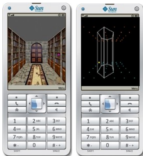
Figura 4: Jogo GeoespaçoMob em execução.

versões futuras. Entretanto, é importante mencionar que os professores que auxiliaram na definição dos conteúdos abordados validaram o roteiro dos jogos. Futuramente, espera-se elaborar cadernos de atividades para utilização destes jogos para que eles sejam inseridos como material de apoio às aulas. Desse modo, as versões para computador dos jogos poderão ser exploradas também com sistemas de projeção para atividades coletivas em sala-de-aula.